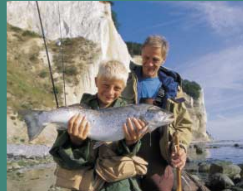
Udgiver: Møn Turistbureau. Redaktion: Annette Tenberg. Layout: BJ IdeReklame. Tryk: Central Trykkeriet.

Et fiskeri der er i stærk udvikling er fluefiskeriet fra kysten. Der kan fiskes med almindelig spinnegrej, buldo- eller bobbardoflåd og et lille udvalg af kystfluer/rørfluer. Med held kan man fiske efter de blanke havørreder selv i de "varme" måneder, bedst tidlig om morgenen eller en sent aften, hvor fiskene kommer tættest på kysten. Waders kan anbefales, dog er det også muligt at fiske direkte fra kysten.